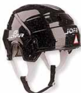
Černá metalíza (14)