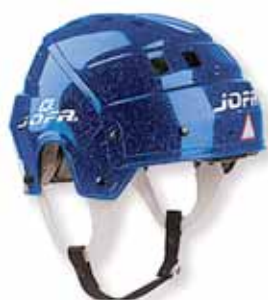
Modrá metalíza (03)

Dvoukusový snadno nastavitelný skelet helmy. Dvojitá vnitřní výplň pro ochranu a pohodlí. Zelená nastavitelná přeska. CE certifikát jako dětská helma. Velikost: S 50-58 cm